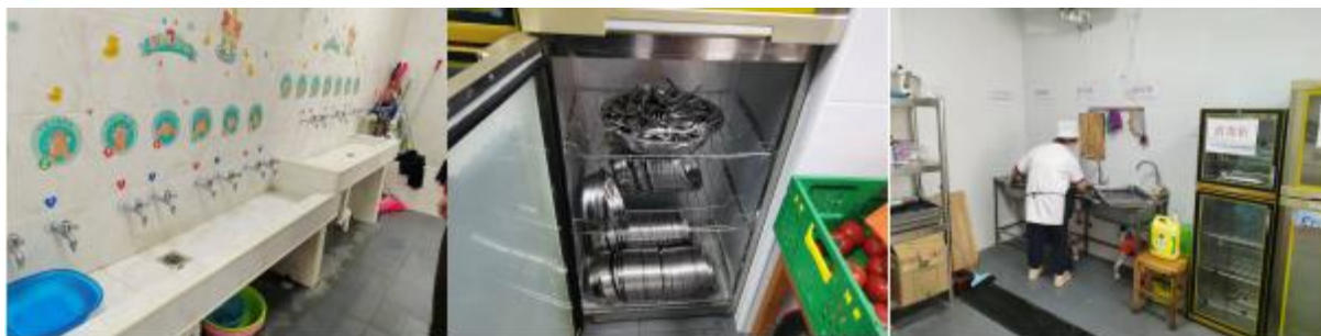
图III-3 就餐卫生情况组图