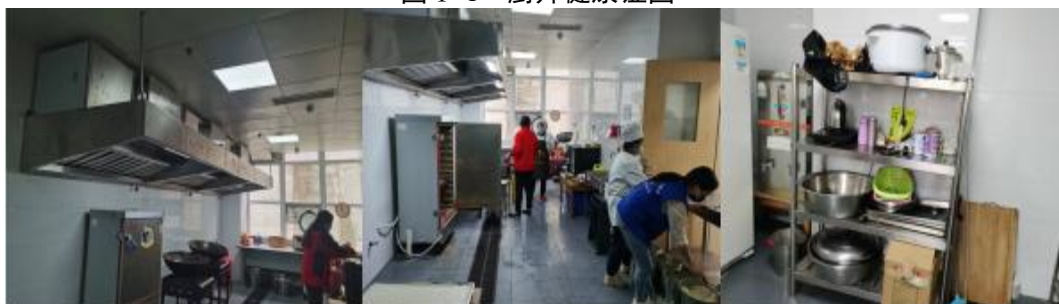
图 I -2 厨师、厨房卫生情况组图