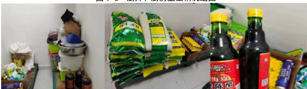
图 I -3 食材储存情况组图