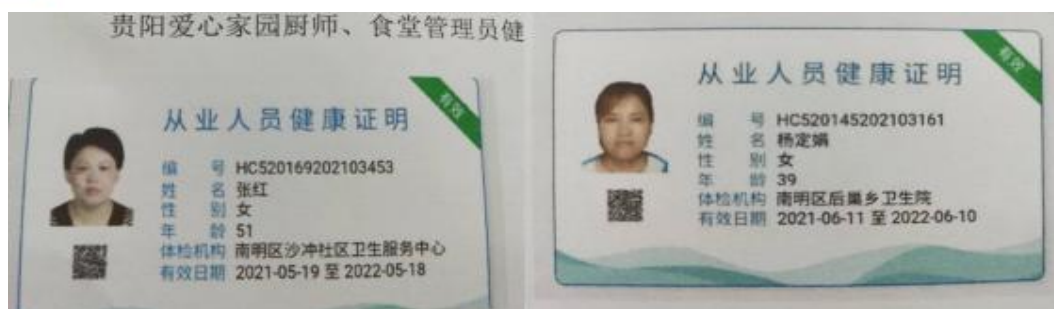
图 I -1 厨师健康证图