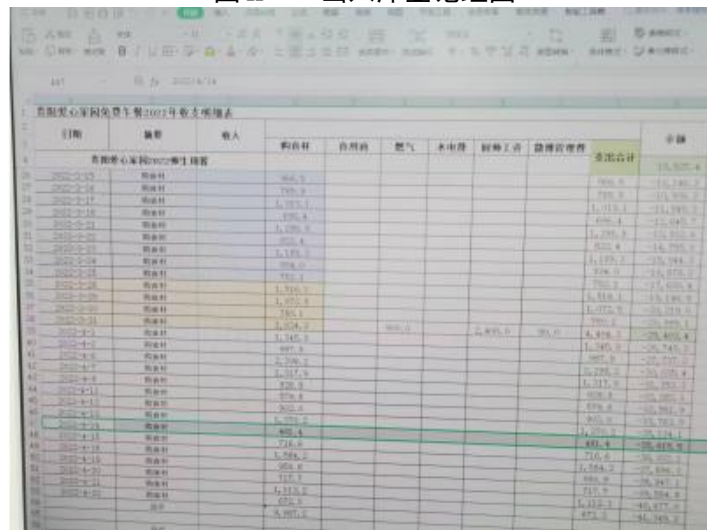
图 II-3 流水账截图