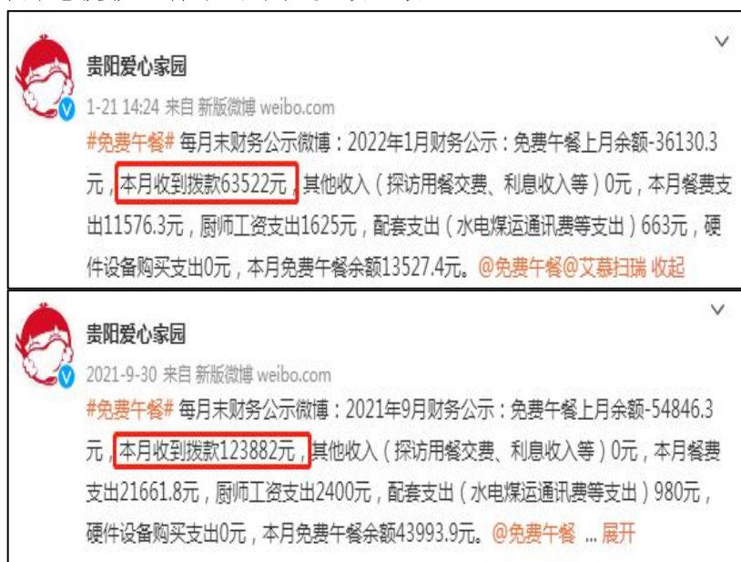
图 2 拨款公示截图

说明：查阅官网及财务最新拨款信息，免费午餐基金分别于 2022 年 1 月 13 日拨款 63522 元和 2021 年 8 月 26 日拨款 123882 元，学校微博分别于 2022 年 1 月 21 日和 2021 年 9 月 30 日对两笔拨款进行了公示，金额一致。