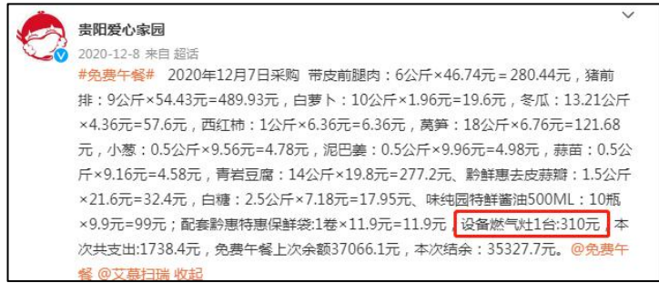
学校微博公示设备采购截图