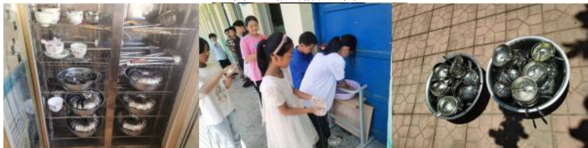
图III-3 就餐卫生情况组图