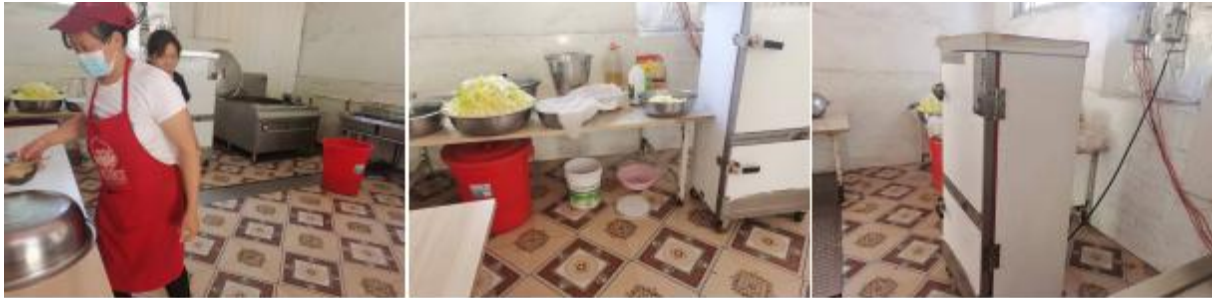
图 I -2 厨师、厨房卫生情况组图