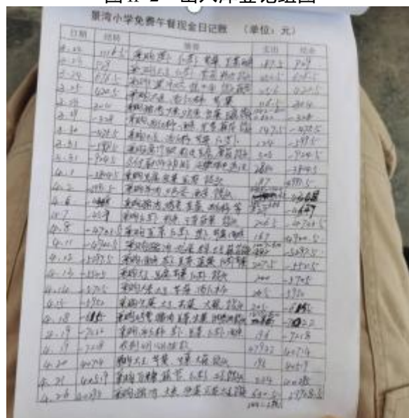
图 II-3 流水账截图