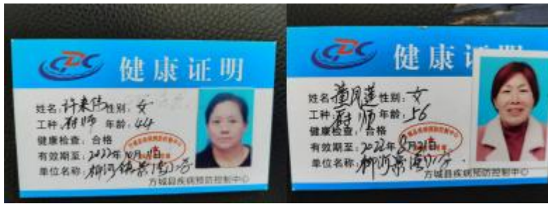
图 I -1 厨师健康证图