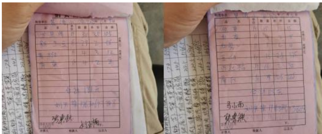
图 II-1 原始凭证组图