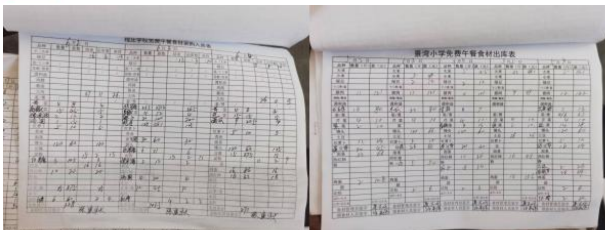
图 II-2 出入库登记组图