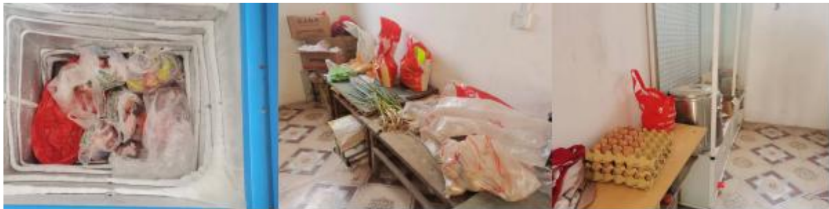
图 I -3 食材储存情况组图