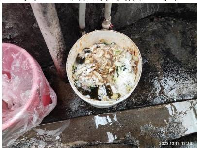
图III-4 餐后泔水桶倾倒图