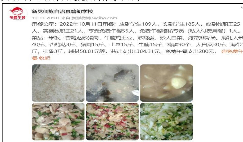
图IV-1 开餐当日微博截图