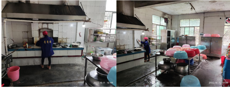
图 I -2 厨房及厨师卫生情况组图