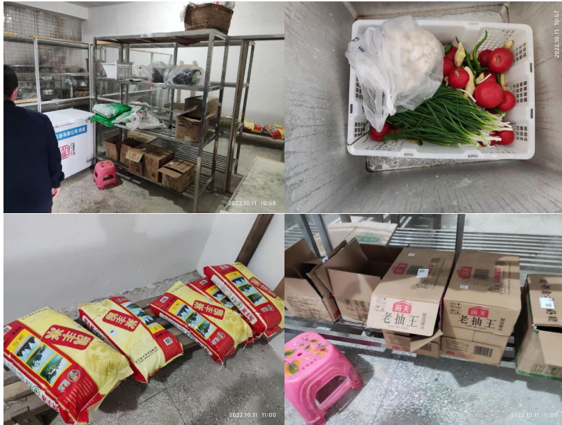
图 I -3 食材仓储情况组图