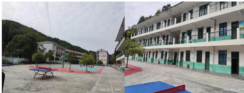
图 3 学校情况组图