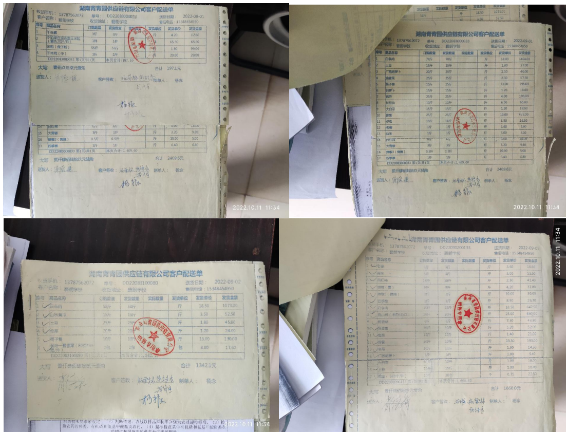
图 II-1 采购凭证组图