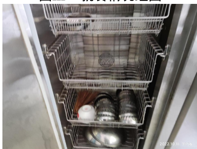
图III-3 餐具消毒情况组图