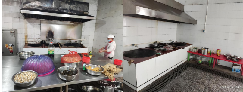
图 I-2 厨房及厨师卫生情况组图