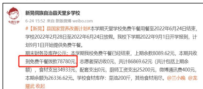
图 2 拨款公示截图

说明: 查阅官网拨款信息及财务最新拨款信息, 免费午餐基金分别于 2022 年 9 月 15 日拨款 54064 元和 2022 年 5 月 5 日拨款 78780 元, 学校于 2022 年 6 月 24 日对第二笔拨款进行了公示, 金额一致, 但未见第一笔拨款公示。