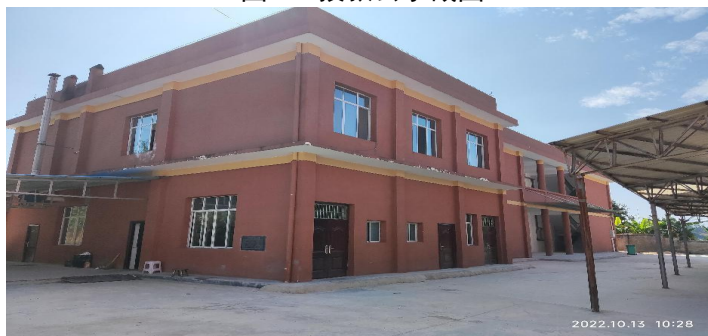
图 3 学校情况组图