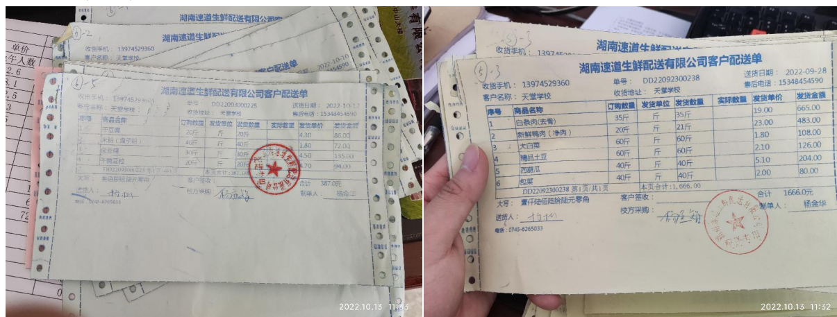
图 II-1 采购凭证组图