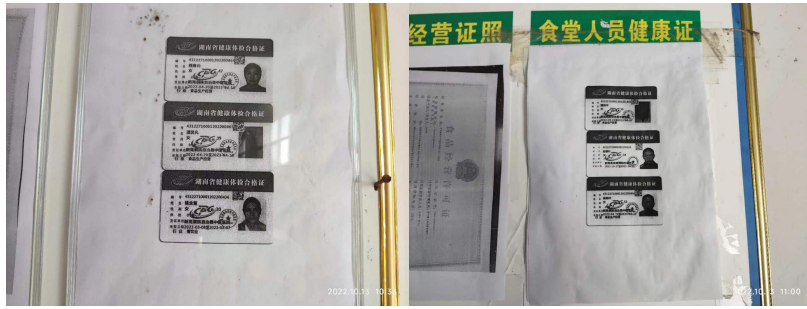
图 I-1 厨师健康证