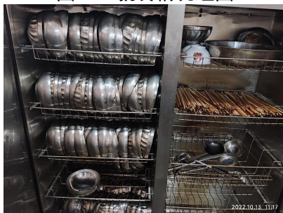
图III-3 餐具消毒情况组图