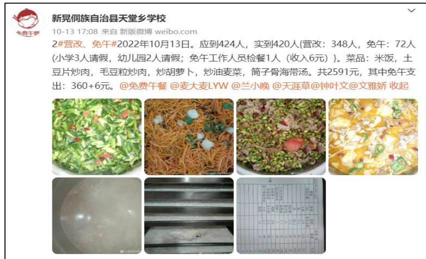
图IV-1 开餐当日微博截图