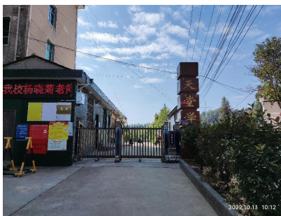
图 1 路况组图

交通说明：自新晃县汽车站乘坐天堂乡方向的流水班车，7点50有一趟班车，在天堂乡下车后步行大约200米左右即可到达学校。