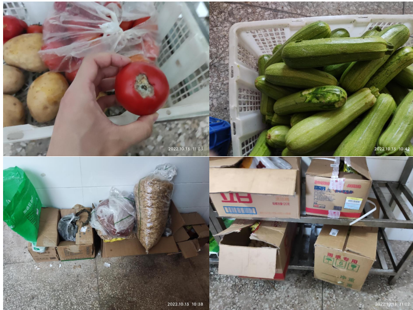
图 I-3 食材仓储情况组图