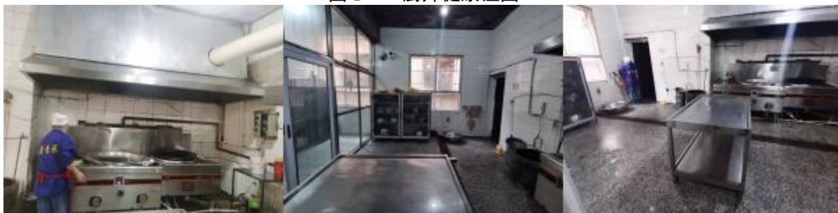
图 I-2 厨师、厨房卫生情况组图