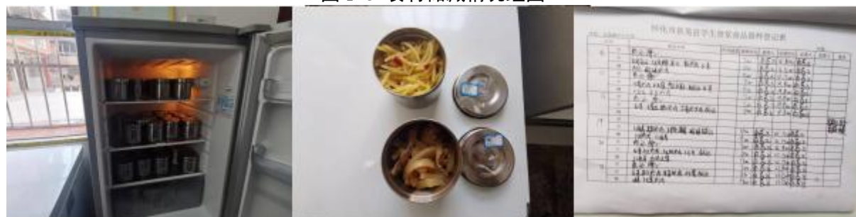
图 I-4 食品留样情况组图