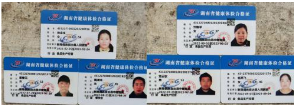
图 I-1 厨师健康证图