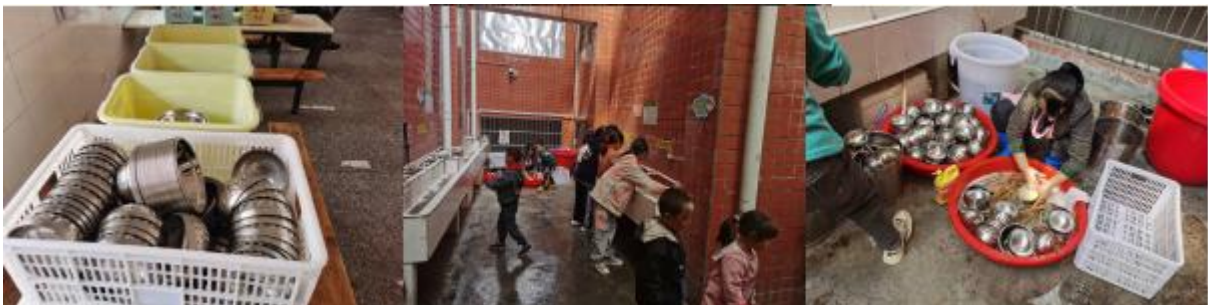
图III-3 就餐卫生情况组图