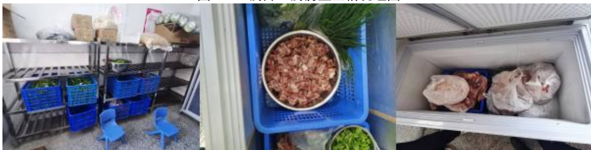
图 I-3 食材储藏情况组图