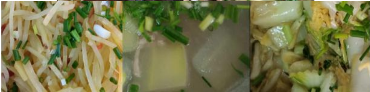
图III-1 开餐当天菜品情况组图