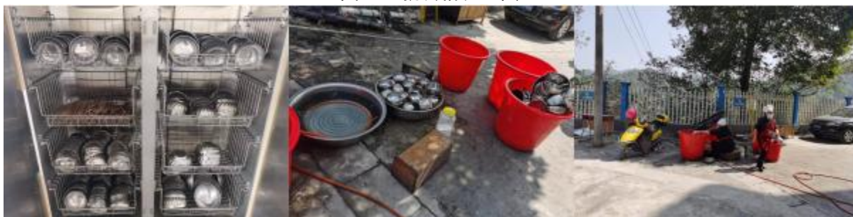
图III-3 就餐卫生情况组图