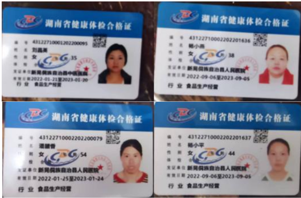
图 I-1 厨师健康证图