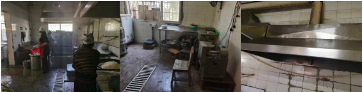
图 I-2 厨师、厨房卫生情况组图