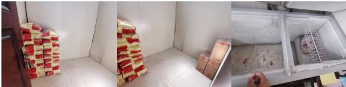
图 I-3 食材储藏情况组图