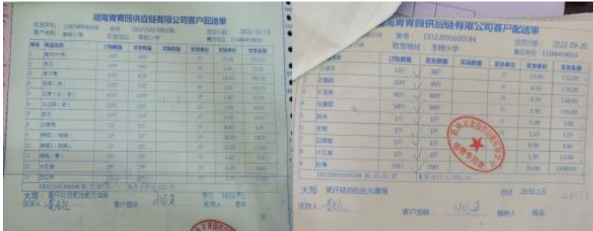
图 II-1 原始凭证组图