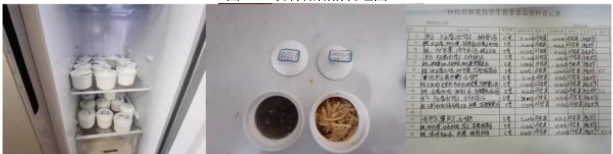
图 I-4 食品留样情况组图